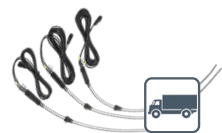
Meracie sondy na meranie teploty Pozri tabuľku