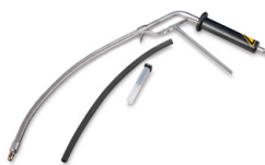
Odberová sonda pre vozidlá so zážihovými motormi (čistočné zaťaženie do 500 °C) 1 680 790 052