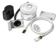
Dovybavenie pre NO x 1 687 001 972