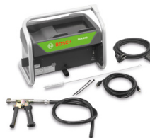
Súprava na dovybavenie pre vznetové motory 1 687 001 989