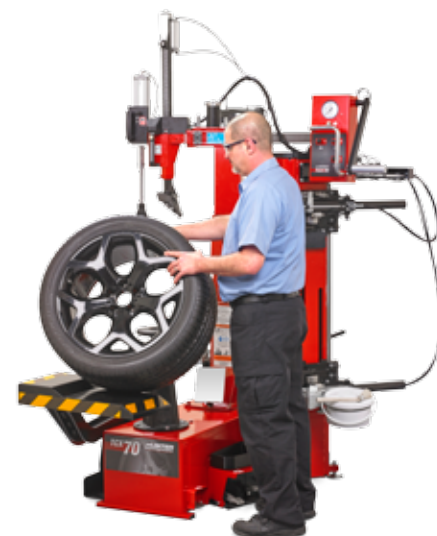
Zvedák kol RP11-8-11100415

Ideální pro leštěná nebo lakovaná kola a kola bez středového otvoru.