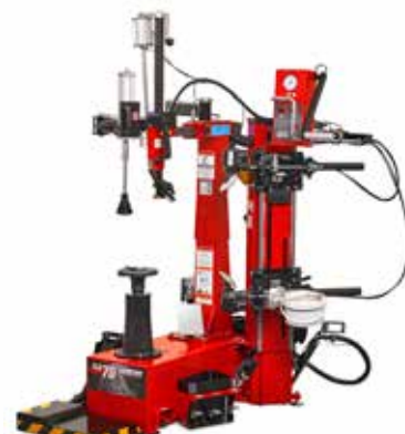
TCX70 s tlakovým dělem a zvedákem kol