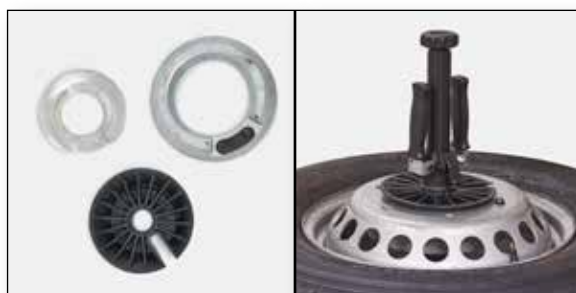
Upínací adaptér – RP11-8-11100417

Okamžitý přísun stlačeného vzduchu přesně tam, kde je ho třeba.