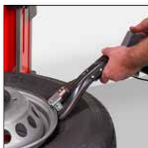
Tlakové dělo RP11-8-11100416

Okamžitý přísun stlačeného vzduchu přesně tam, kde je ho třeba.