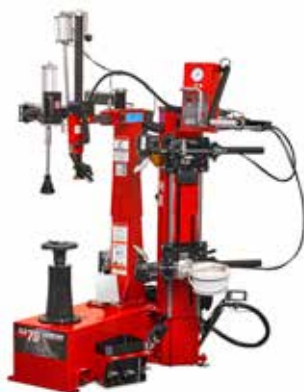
TCX70 s tlakovým dělem