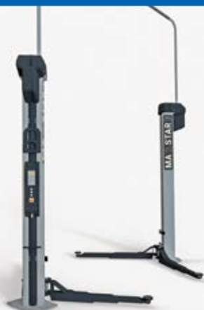
Abb. MA STAR 3.5 A