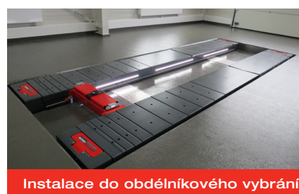
Instalace do obdélníkového vybrání