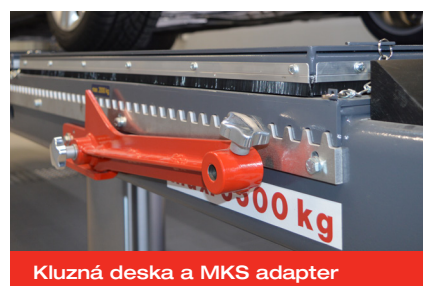
Kluzná deska a MKS adapter